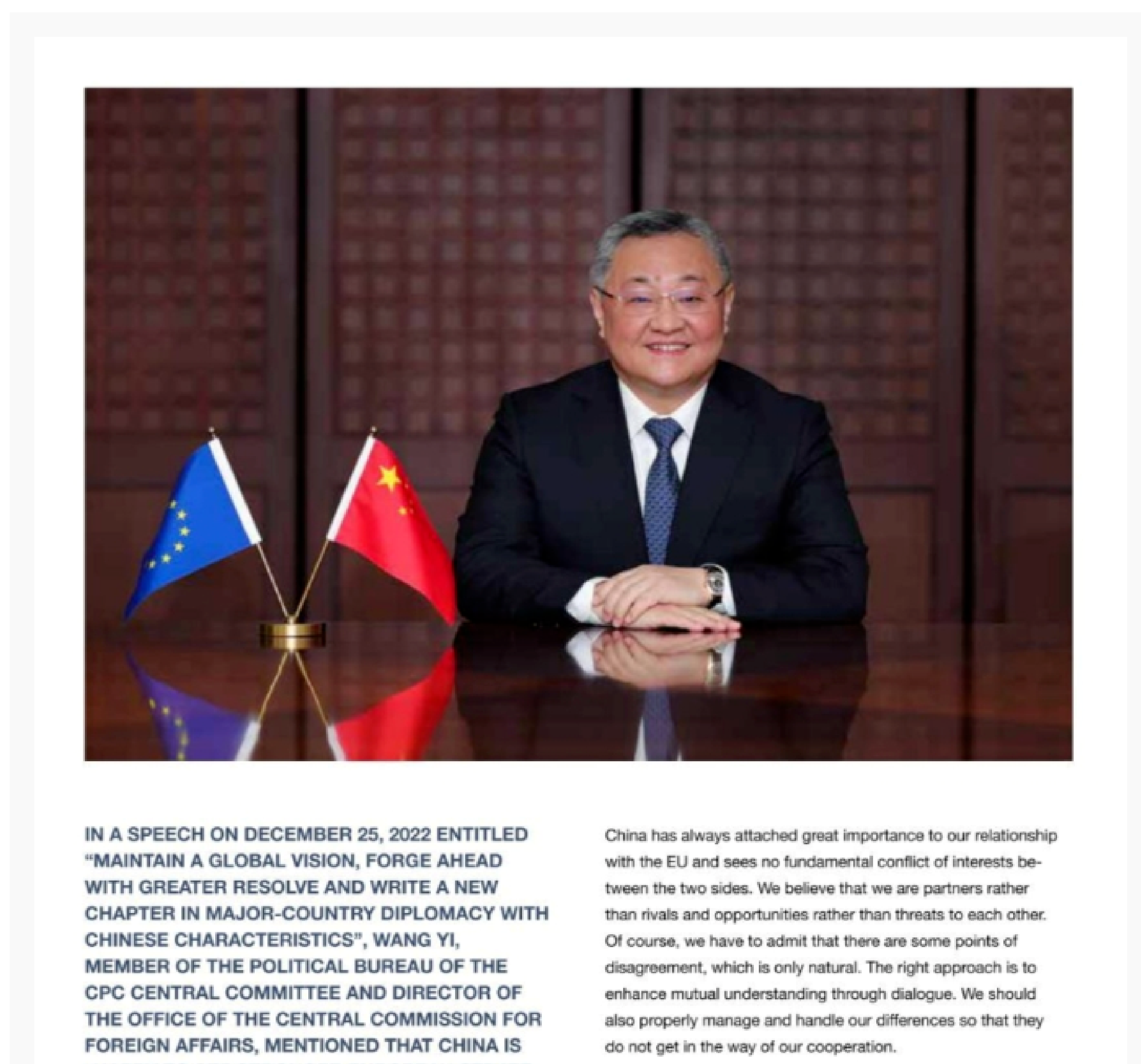
IN A SPEECH ON DECEMBER 25, 2022 ENTITLED "MAINTAIN A GLOBAL VISION, FORGE AHEAD WITH GREATER RESOLVE AND WRITE A NEW CHAPTER IN MAJOR-COUNTRY DIPLOMACY WITH CHINESE CHARACTERISTICS", WANG YI, MEMBER OF THE POLITICAL BUREAU OF THE CPC CENTRAL COMMITTEE AND DIRECTOR OF THE OFFICE OF THE CENTRAL COMMISSION FOR FOREIGN AFFAIRS, MENTIONED THAT CHINA IS