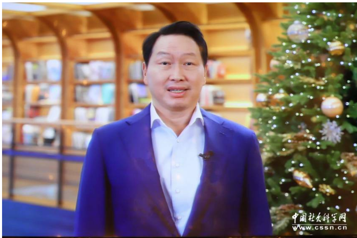
韩国SK株式会社董事长兼首席执行官崔泰源致辞