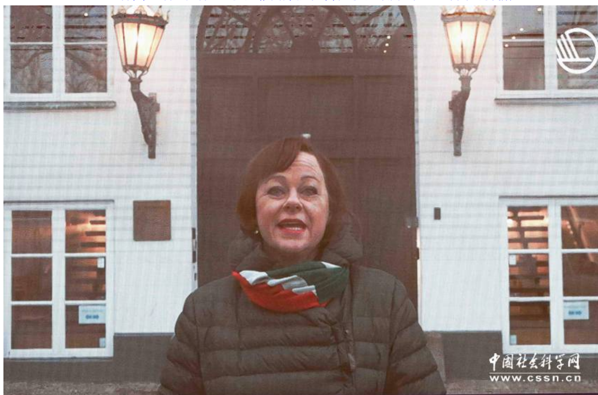
北欧部长理事会秘书长宝拉·莱赫托麦基 (Paula Lehtomaki) 致辞