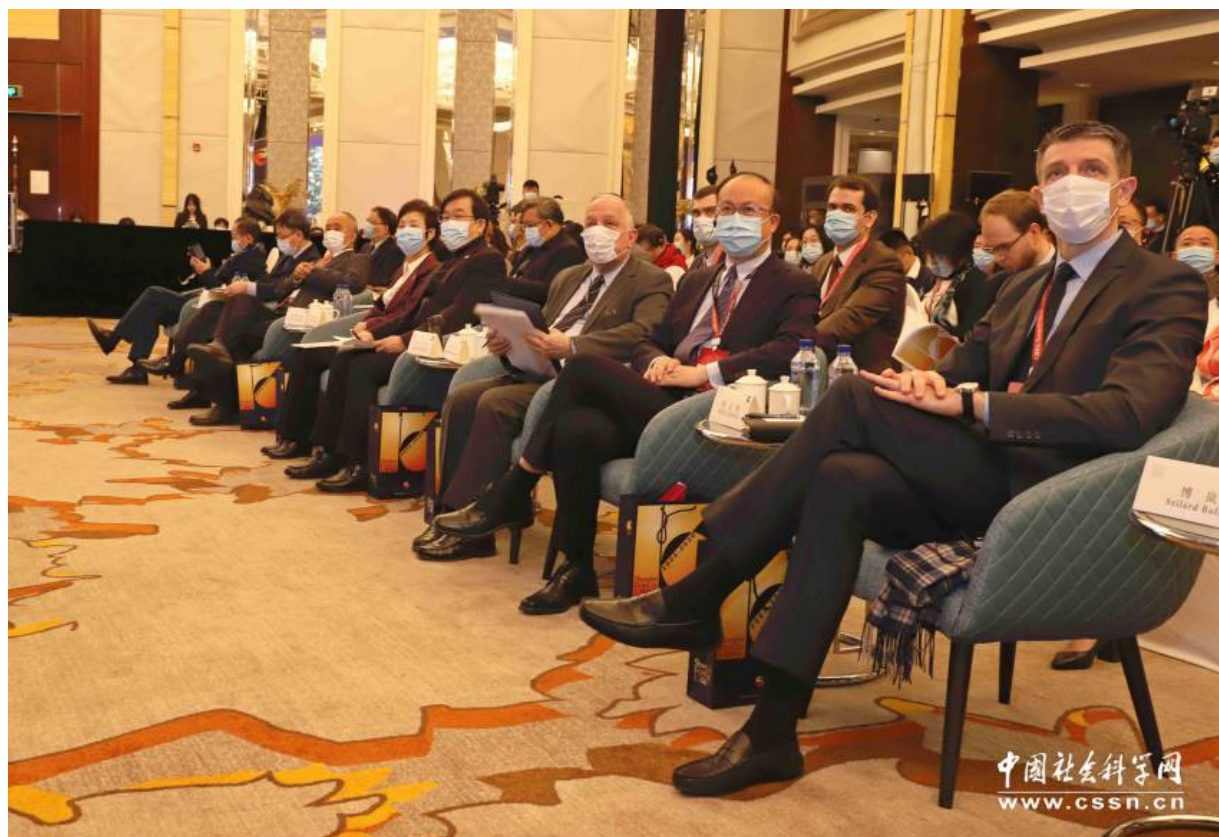
“上海论坛2020”年会现场之二

据悉，上海论坛是国际大型学术论坛，是目前在上海举办的最具国际影响力的品牌论坛之一。自2005年创办以来，已走过15年历程。论坛以“关注亚洲、聚焦热点、荟萃精英、推进互动、增强合作、谋求共识”为宗旨，致力于搭建中外政商学界人士共同交流沟通的平台。论坛始终坚持创新引领，为区域发展、国家大计以及人类命运共同体构建建言献策，为上海全面深化“五个中心”建设、加快建设具有世界影响力的社会主义现代化国际大都市汇聚全球智慧。