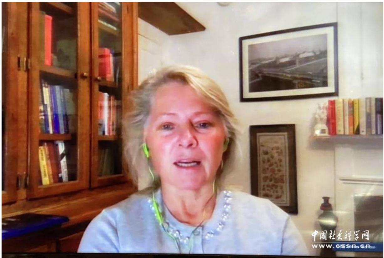
美国前代理助理国务卿董云裳 (Susan Thornton) 作主旨演讲