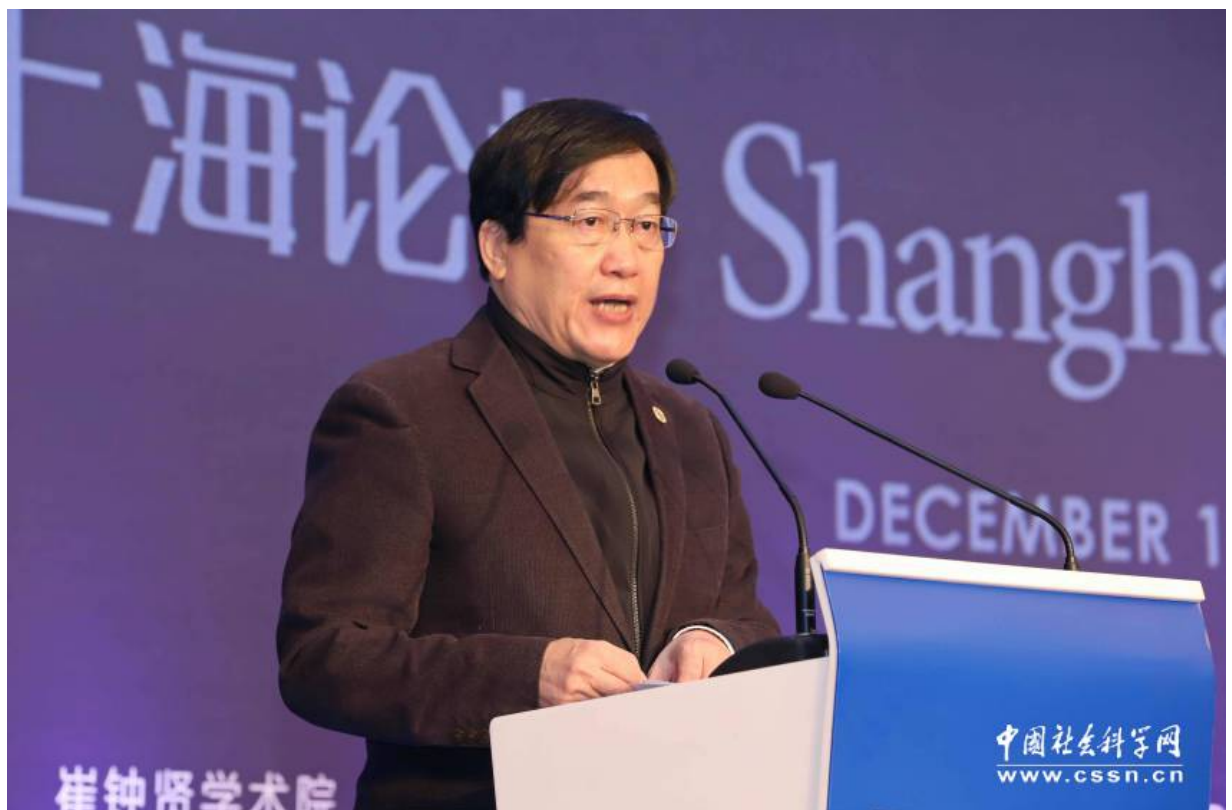
复旦大学校长、中国科学院院士许宁生致辞