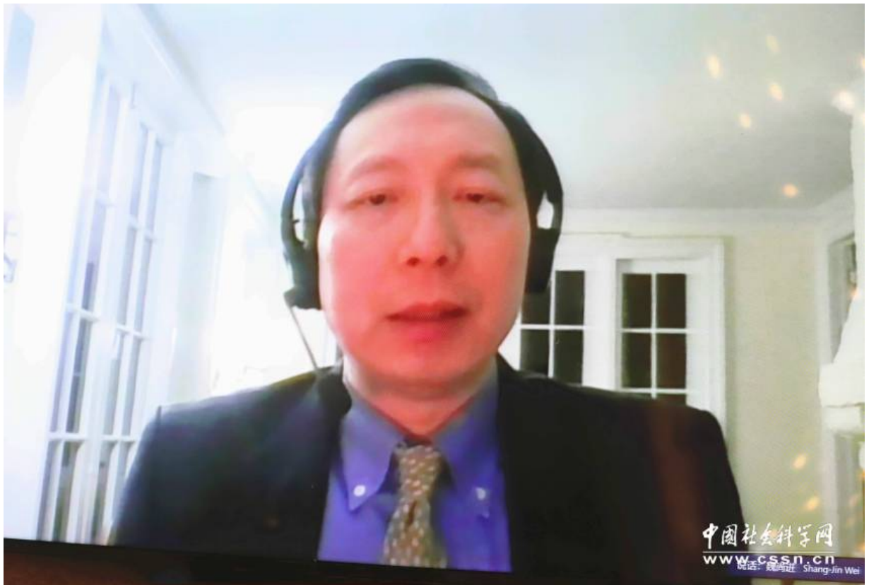
复旦大学泛海国际金融学院金融经济学学术访问教授、美国哥伦比亚大学终身讲席教授魏尚进作主旨演讲