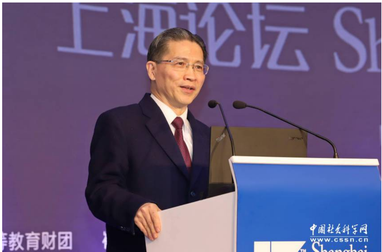
全国政协常委、民建中央副主席、上海市政协副主席周汉民作主旨演讲