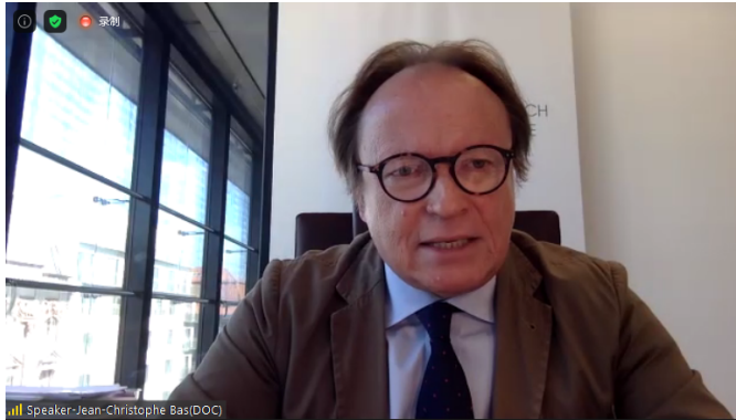
德国文明对话研究院首席执行官Jean-Christophe Bas

德国文明对话研究院首席执行官Jean-Christophe Bas先生简要介绍了文明对话研究院的使命和工作，并围绕人类共同的价值和共同的未来，以及如何建设一种新的国际主义进行了分享。他指出，今年适逢联合国创建75周年。联合国的建立是基于关于安全、平等和人的尊严的全球共识。延续这一历史经验，新的国际主义呼吁人们互相倾听、弥合鸿沟，文明之间的畅通而丰富的对话将有利于打破偏见，建立共识。他认为，欧洲将在塑造新世界秩序中扮演重要角色，包括承认多元文化，致力更多合作等。