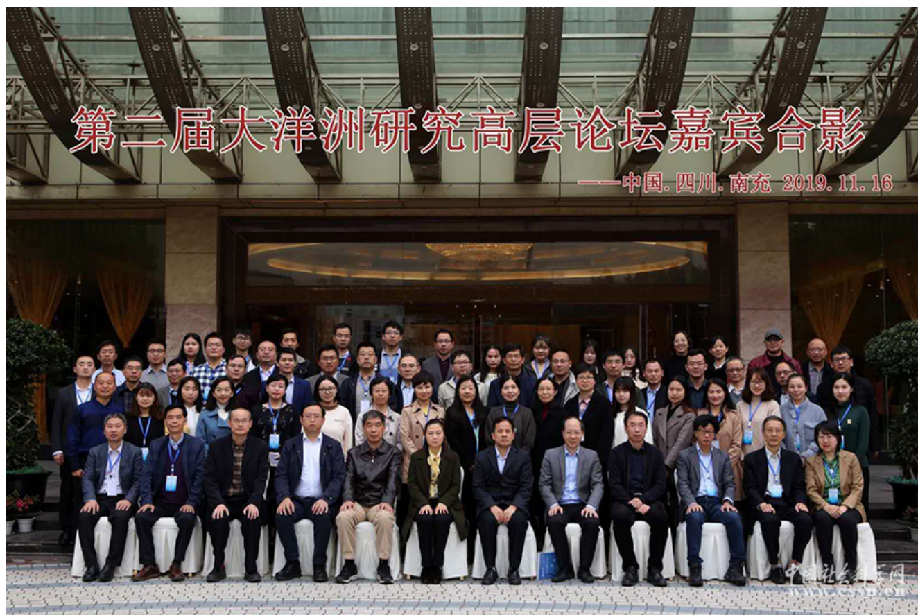
与会人员合影留念