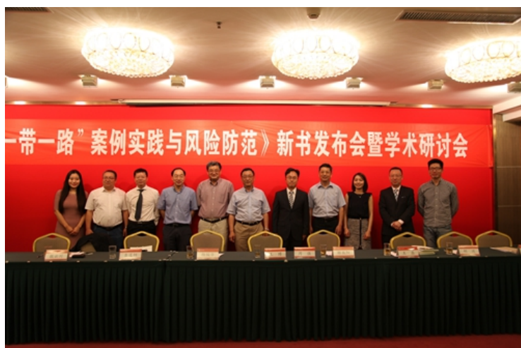
部分与会嘉宾合影

新书发布会后，百余名与会专家、学者围绕助力企业遨游“一带一路”分四个论坛进行了热烈讨论。四个论坛探讨的主题分别为：法律人的策略与方法；中国企业在“一带一路”建设中的文化沟通与文化适应；中国企业参与“一带一路”建设，如何在政治变革中趋利避害；企业跨国运营的责任：边际与认可。与会者积极发言、热烈讨论，研讨会取得圆满成功。