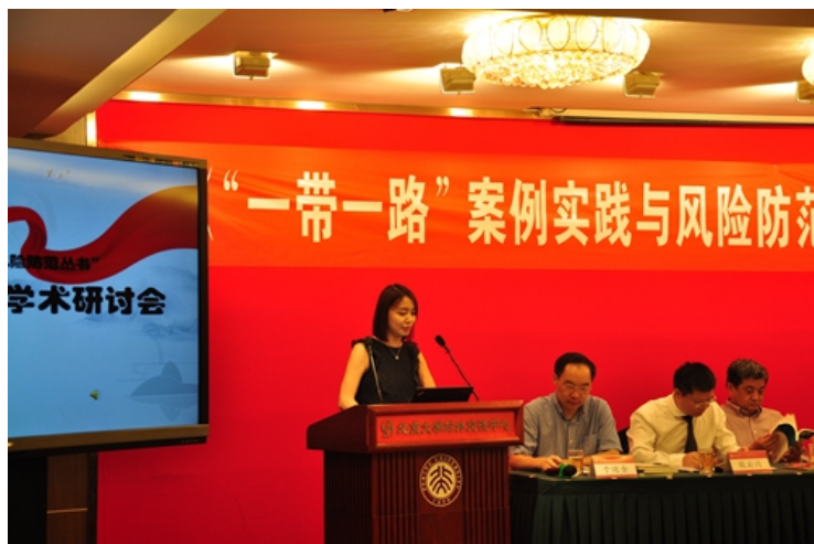
胡然介绍政治安全属内容