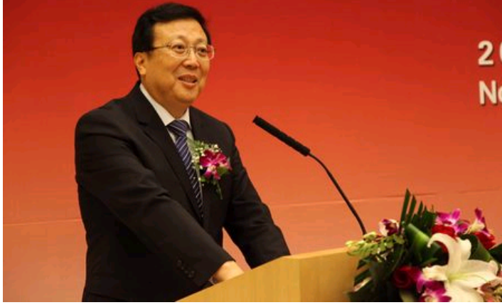
教育部副部长郝平致辞

郝平在致辞中肯定了中美人文交流研究基地自2011年试运行以来所取得的成绩，并提出三点期待：希望中美人文交流研究基地更加出色地履行使命，各位专家学者更加深入地研究中美人文交流，老师和同学们更加积极地参与中美人文交流。