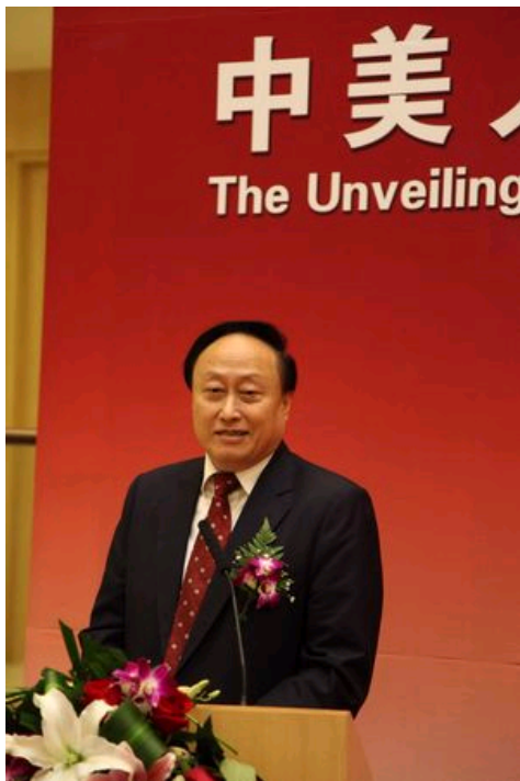
北大党委书记朱善璐致辞

11月3日下午，中美人文交流研究基地揭牌仪式在北京大学斯坦福中心李兆基大厅举行。教育部副部长郝平，北京大学党委书记朱善璐，教育部国际合作与交流司副司长杨军，中共中央党校战略研究所副所长潘悦，北京大学副校长李岩松，以及来自北京大学、清华大学、复旦大学、北京外国语大学及哈佛大学等中美高校及研究机构的专家学者出席了揭牌仪式。仪式由李岩松主持。