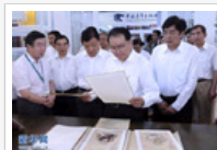
李长春参观第19届图博会