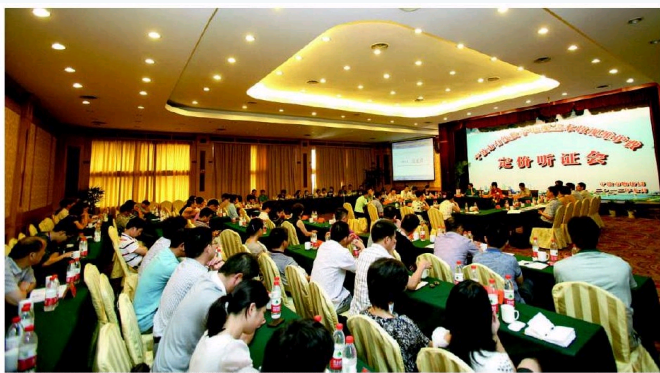
■ 社会建构主义强调不同社会主体之间平等、合作、协商和互动的重要意义。

2013年02月08日 00:02 来源: 《中国社会科学报》2013年2月8日第415期 作者: 韩志明 韩阳 浏览: 次 我要评论 字号: 大 中 小