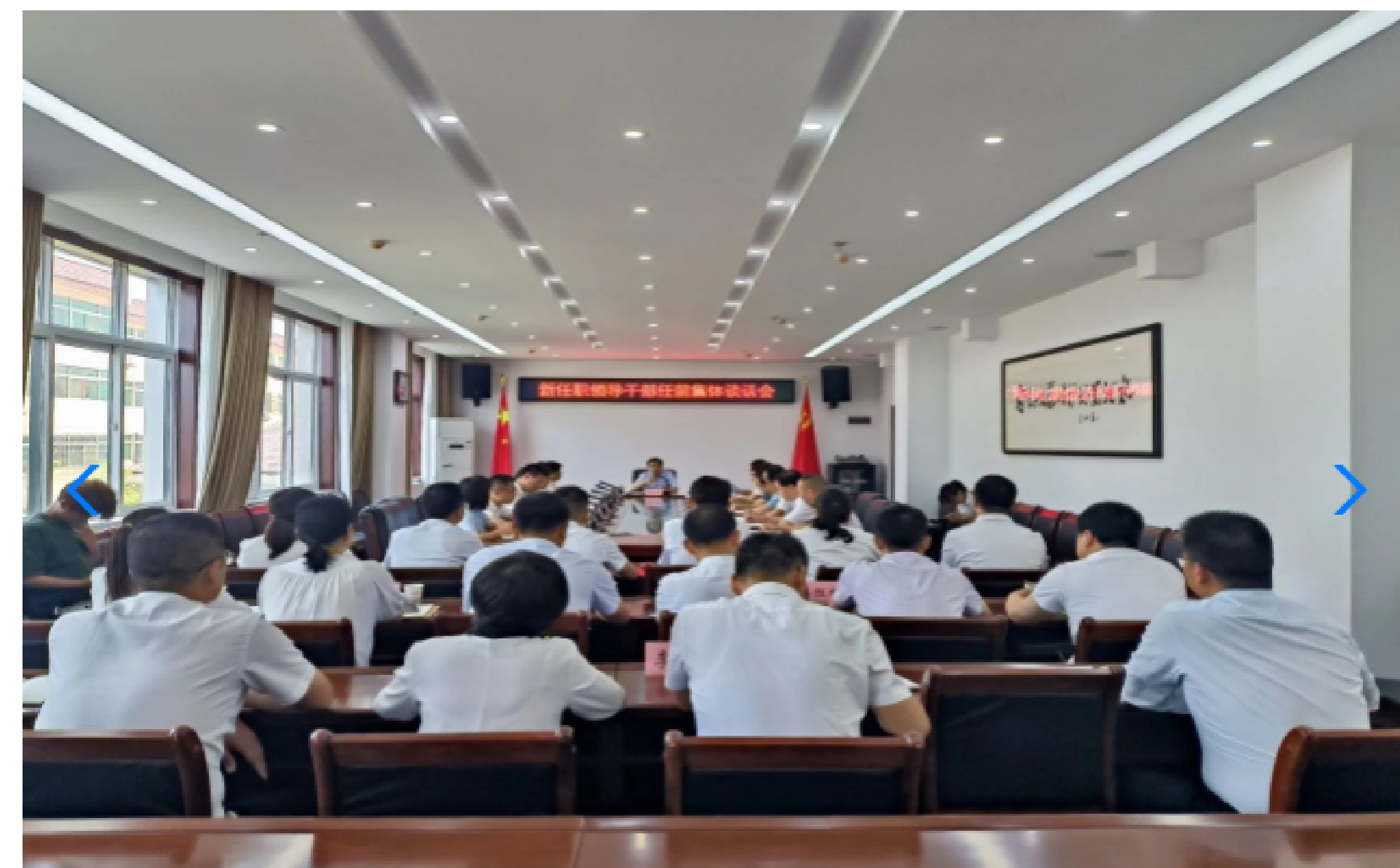
周至县召开新任职领导干部任前集体谈话会议