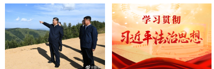
习近平在塞罕坝机 ...