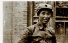
揭秘：贺子珍葬礼规格如何