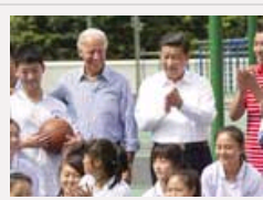
习近平同拜登参观都江堰灾后重建项目