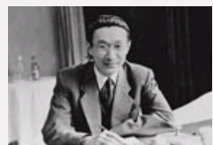
王稼祥：新中国首位驻外大使的传奇人生