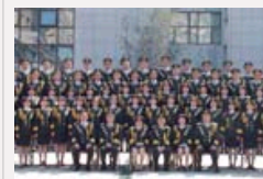
组图：数十位元勋将帅后代齐聚唱红歌