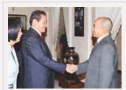
周永康会见柬埔寨国王西哈莫尼