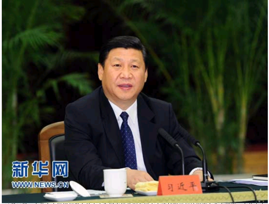
10月11日，中共中央组织部举办的中央和国家机关到省区市交流任职干部培训班在北京开班。中共中央政治局常委、中央书记处书记、国家副主席习近平与培训班学员座谈。