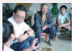
赵乐际深入农户调研