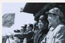
独家解密——历年国庆阅兵数据