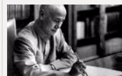
蒋介石日记披露抗战期间对日密谈内幕