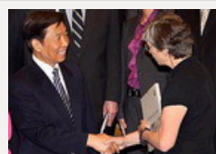
李源潮会见美国客人