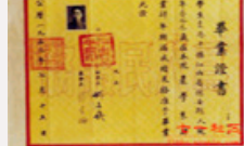
袁隆平大学毕业证是啥样