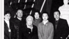
毛主席家族的漂亮女孩