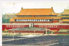
毛泽东逝世33周年 一生不 负凌云志