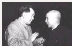
最早发现毛泽东有雄才伟略的人是谁