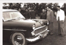
“红旗”车阅兵历程 林彪 第一个乘坐检阅部队