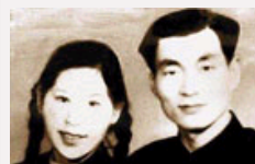
【组图】朱镕基风采魅力照