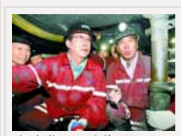
郭庚茂深入矿井下调研：抓安全就不能怕得罪人