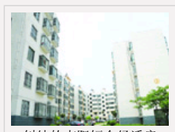
纠结的南阳短命经适用房