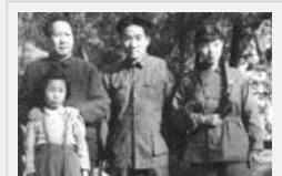
毛泽东的儿女今何在