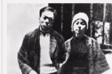
组图：我党历史上“弄假成真”的7对著名革命夫妻