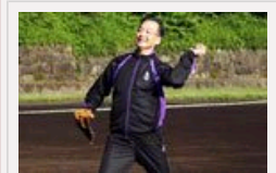
温总理东京再展棒球技艺