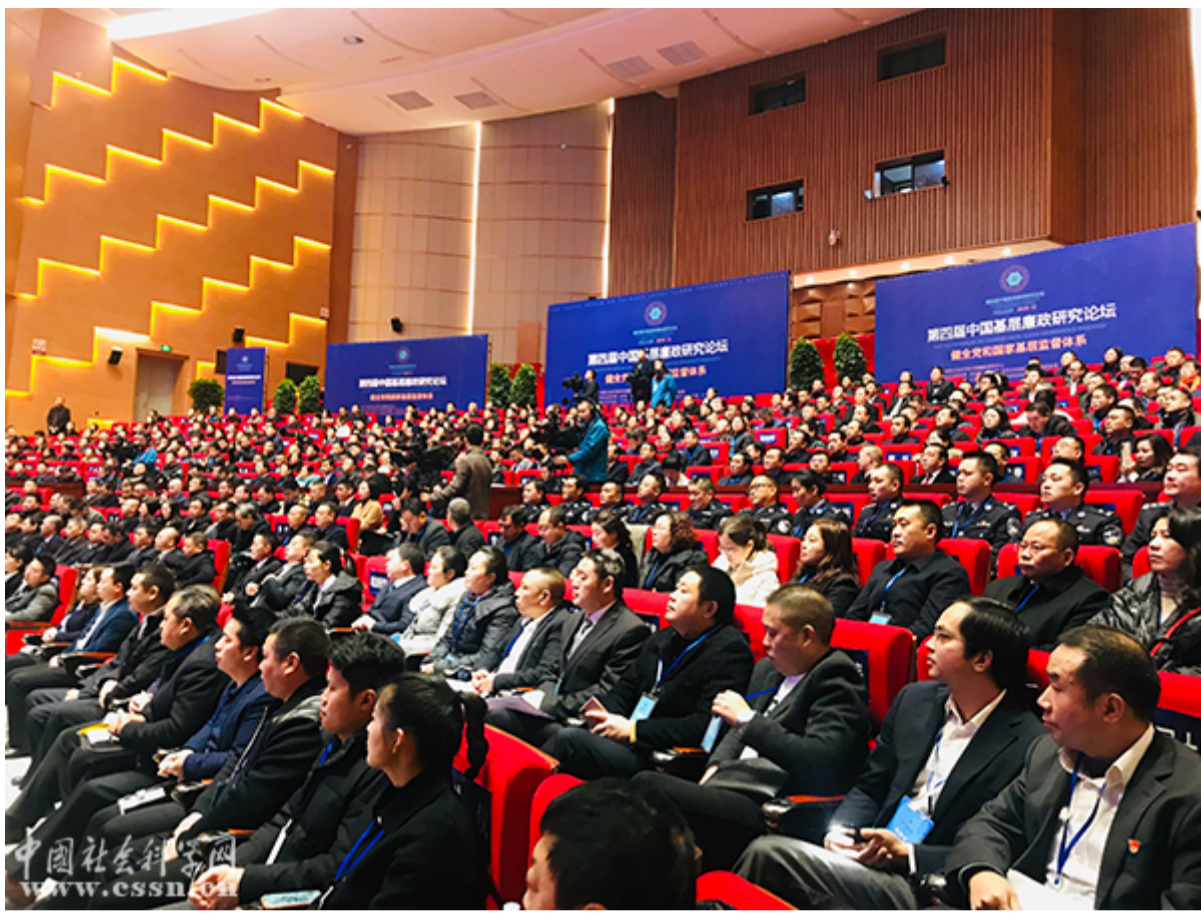
开幕式现场