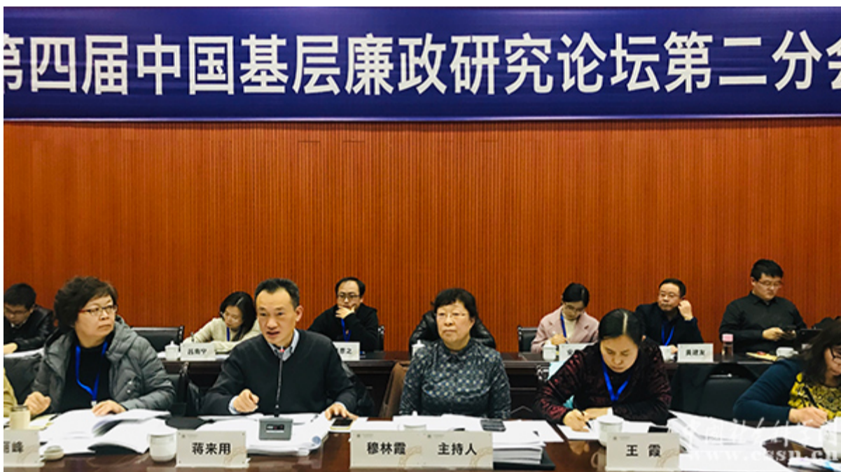
第四届中国基层廉政研究论坛分会场