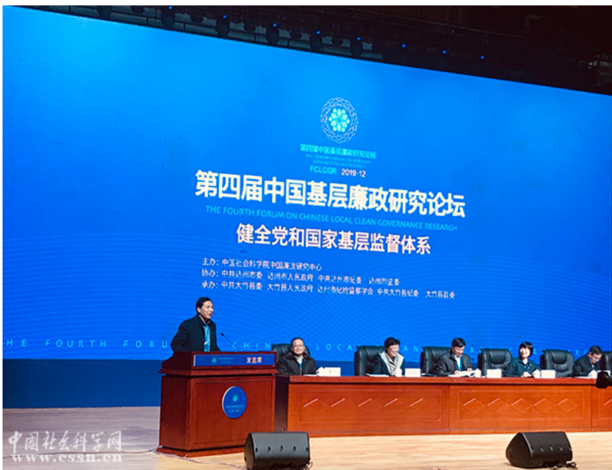
分会场代表在闭幕式上介绍各自会场研讨情况