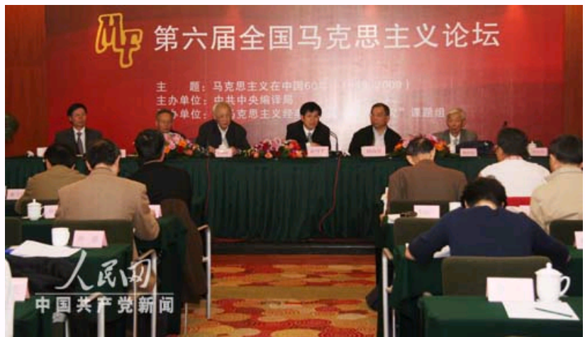
第六届全国马克思主义论坛会场

【字号 大 中 小】 打印 留言 社区 网摘 手机点评 纠错 E-mail推荐: 提交