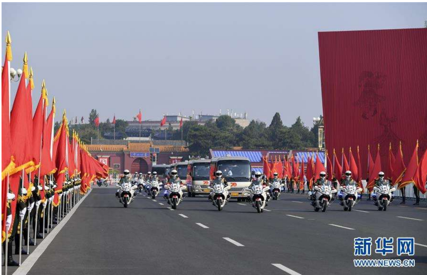
9月29日上午，国家勋章和国家荣誉称号获得者乘坐礼宾车，在国宾护卫队的护卫下，前往人民大会堂。经中共中央批准，中华人民共和国国家勋章和国家荣誉称号颁授仪式于9月29日上午10时在北京人民大会堂隆重举行。