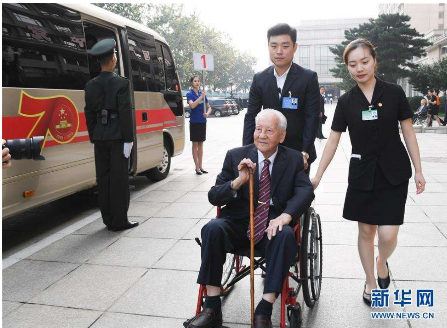
9月29日，“共和国勋章”获得者黄旭华在京西宾馆上车。经中共中央批准，中华人民共和国国家勋章和国家荣誉称号颁授仪式于9月29日上午10时在北京人民大会堂隆重举行。