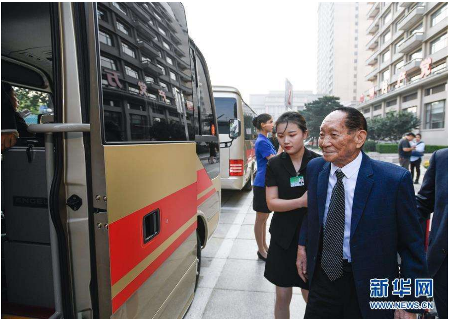
9月29日，“共和国勋章”获得者袁隆平在京西宾馆上车。经中共中央批准，中华人民共和国国家勋章和国家荣誉称号颁授仪式于9月29日上午10时在北京人民大会堂隆重举行。