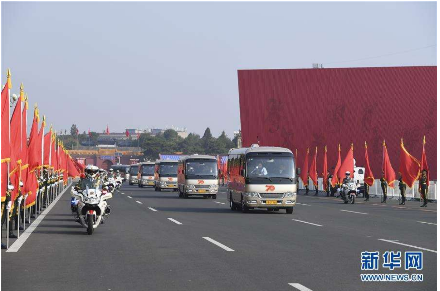
9月29日上午，国家勋章和国家荣誉称号获得者乘坐礼宾车，在国宾护卫队的护卫下，前往人民大会堂。经中共中央批准，中华人民共和国国家勋章和国家荣誉称号颁授仪式于9月29日上午10时在北京人民大会堂隆重举行。