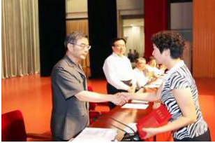
最高法、河南省委追授李..