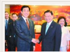
薄熙来会见江丙坤：两协议在山城签署真是“重庆”