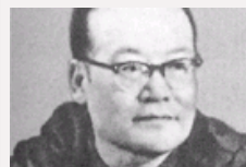
毛泽东为啥信任纪登奎？敢于讲真话、讲实话