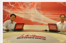
姚桓：为何每开一次党代会都要修改党章？