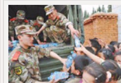
战士抗旱日记：身上不是被晒暴皮 就是被磨破