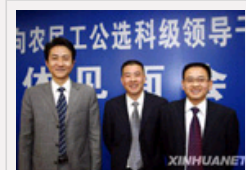
四川遂宁：公选农民工科领导干部公开亮相