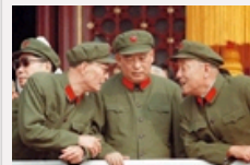
历数中国八位国防部长：张爱萍推动国防现代化