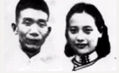
风雨茅庐几多情：郁达夫 与王映霞最终劳燕分飞