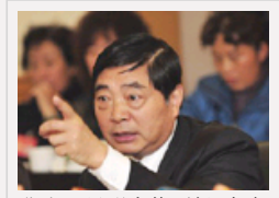
仇和：昆明房价不低 存在 巨大贪污腐败