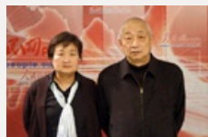
陈赓傅涯子女陈知建、陈知进回忆父亲母亲