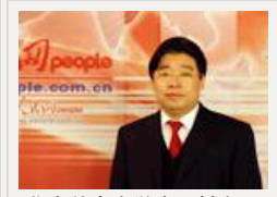
北大首个大学生“村官” 任湘潭市委副书记