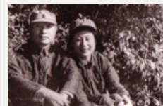
顶天立地傲苍穹——忆张爱萍上将