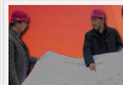
灾区干部：需要关注需要爱