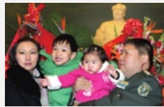
毛新宇一家四口祭拜毛主席 纪念堂接纳人数超两万