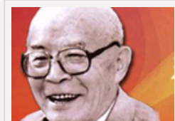
吕正操：他带走了一个时代