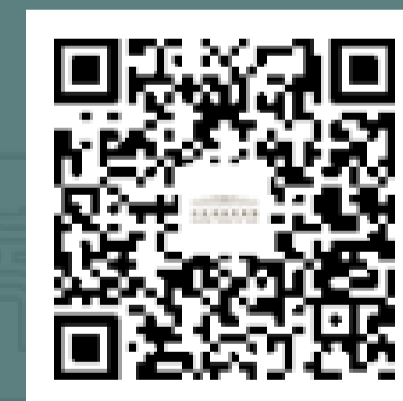
国博君 微信订阅号