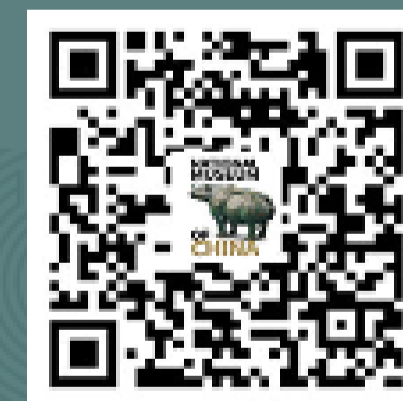
国家博物馆英文版 微信服务号