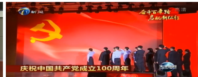
我局举办庆祝建党百年情景讲述会