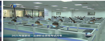
2021年国家统一法律职业资格考试开考