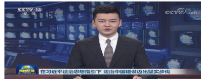
在习近平法治思想指引下 法治中国建设迈出坚实步伐