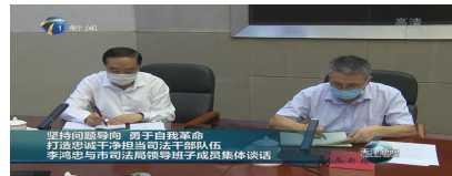
李鸿忠与市司法局领导班子成员集体谈话