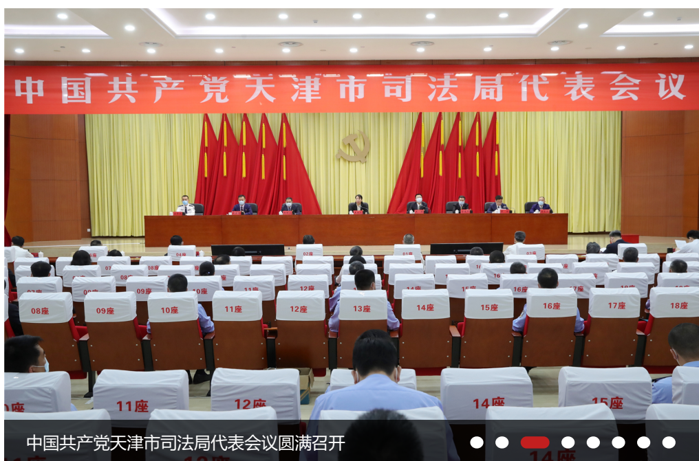
中国共产党天津市司法局代表会议圆满召开