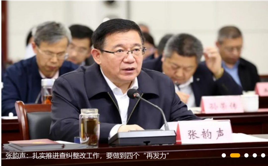
张韵声: 扎实推进查纠整改工作, 要做到四个“再发力”