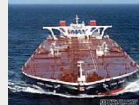
美国亿万富翁购置30…