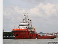
黄埔造船“海洋石油…