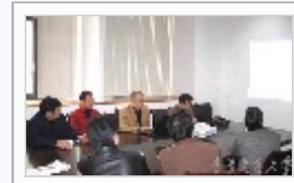
中心参加学校召开的绕城...