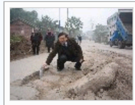
“重庆市农村公路交通安...