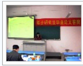
中心一批硕士生通过学位答辩