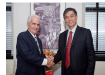
古巴高等教育部副部长