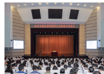
学校召开2014年人才培