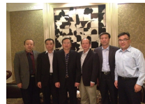
北卡罗来纳州立大学客