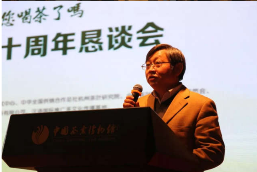
江用文理事总结回顾“全民饮茶日”十周年历程