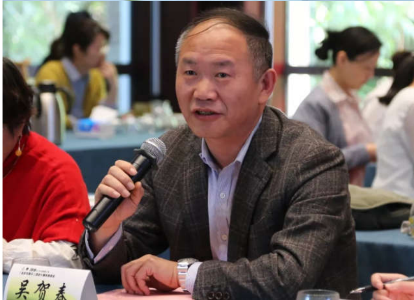
各专家积极建言献策