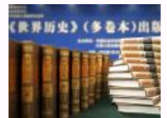
《世界历史》（多卷本）首发 使世界史研究体现