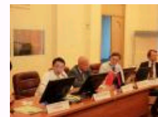
《胡华文集》出版发行 推动党史研究与教学