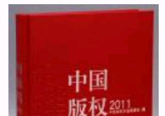
《中国版权年鉴2011》正式出版发行