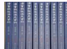
《〈清实录〉经济史资料（从顺治到嘉庆）》正式