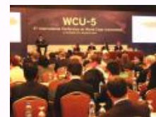
“第五届世界一流大学国际研讨会”在上海交大召