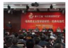
第十三届“马克思主义论坛”在北京大学召开