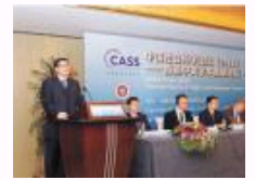
中国学术走向世界的期刊进行时