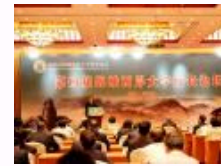
第四届海峡两岸大学校长论坛开幕