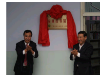
中国煤炭工业协会...