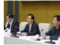
张德江出席全国煤...