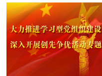
大力推进学习型党...