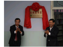
中国煤炭工业协会...