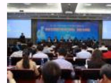
两岸四地专家学者南开研讨公共管理