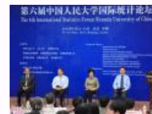
第六届中国人民大学国际统计论坛举办