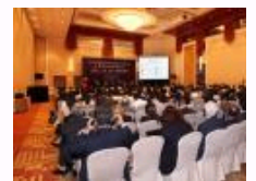
对外经济贸易大学成功主办“第三届中国竞争政策”论坛