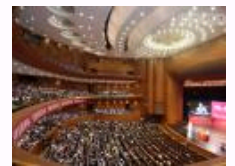
首届“清华五道口全球金融论坛”举行 清华大学