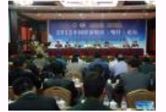
2012中国经济特区(喀什)论坛在喀什举行