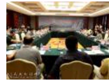
“转型与创新:中国经济社会学发展的新阶段”论