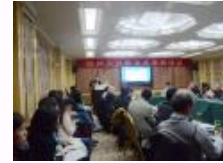
中国人口政策改革研讨会召开