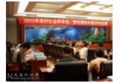
2013年“农村社会学”论坛在贵阳召开