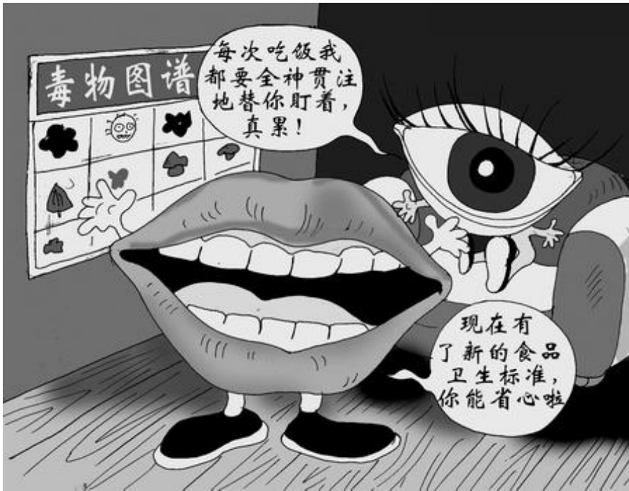
32项新规元旦起开始实施 涉及到衣食住行各方面