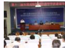
第十三届全国高校区域经济学学科建设年会暨构建