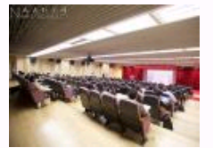
思想政治教育学科设立30周年学术研讨会在人民大