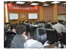
首届全国公共管理学领域城市相关学科发展研讨会