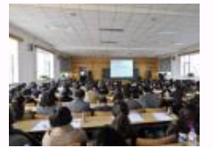
全国高校思想政治理论课教学方法改革现场经验交