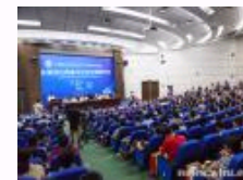
中国社会学会2014年学术年会在武汉大学召开