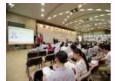
人大重阳举办十二国智库论坛 首议“丝绸之路经