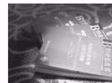
关于建设中国特色新型智库的调查与思考