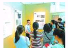
我国智库建设进入井喷期 高校成为新型智库排头