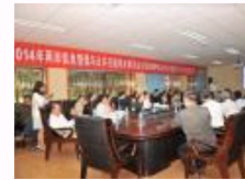
2014年两岸信息管理与公共行政学术研讨会举行