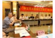
“中文学术图书引文索引”研讨会在南大举行