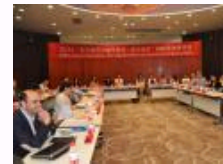
“重访城市”国际研讨会在上海交大举行