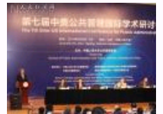
第七届中国公共管理国际学术研讨会在人民大学举行