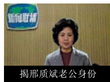
揭邢质斌老公身份