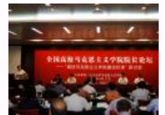
第三届全国高校马克思主义学院院长论坛在北大举