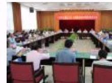
“《楚辞文献丛刊》出版暨楚辞文献整理座谈会