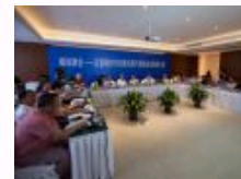
中国传媒大学举行“媒体融合:互联网时代的新机