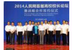
人民网首届高校校长论坛今日在京举行