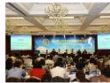
第三届公司法司法适用高端论坛召开