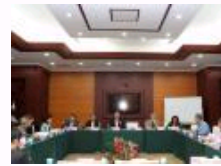
人权建设与宪法秩序暨“人权入宪”十周年学术研