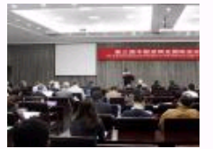
中国逻辑史第三届国际会议南开召开