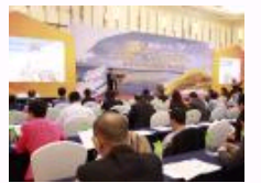
2014首届中国（广州）专业市场发展年会广州召开