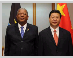
习近平会见安提瓜和巴布达总理斯潘塞