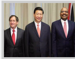
习近平会见特立尼达和多巴哥参议长史密斯和众议长马克