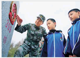
兴凯湖畔“哨所小学”