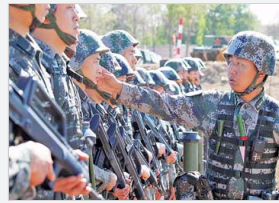
这样的连长咱们服！（组图）