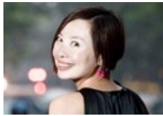
总统声线帮你做职场领袖