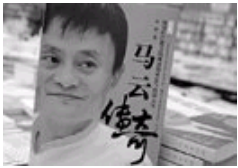
我不仇富仇的是不公