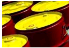
谁来为油价上涨埋单