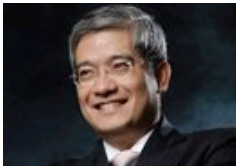
应该买房子还是买黄金