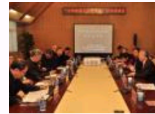
“中华传统文化的特色”学术座谈会在北外举行