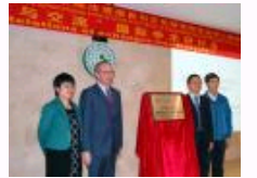
中山大学外国语学院举办“中法关系与交流”国际