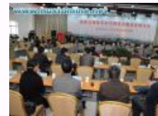
华中科技大学国家治理研究院举办高峰论坛