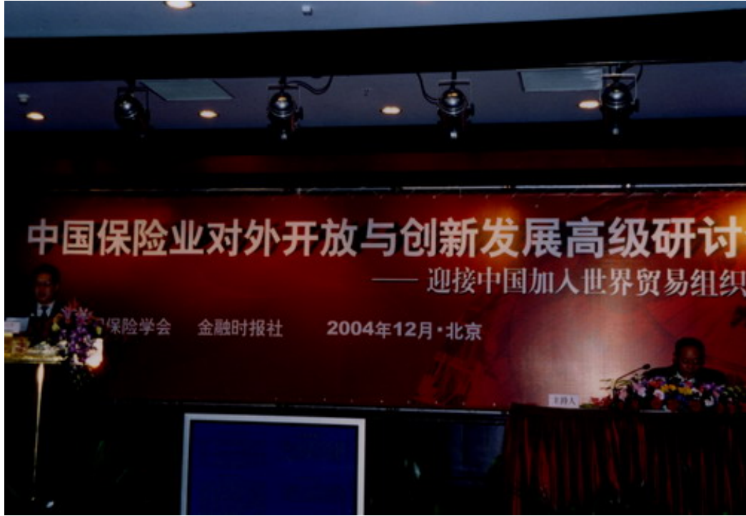
中国保险业对外开放与创新发展高级研讨会现场二