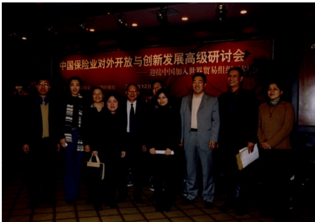
中国保险业对外开放与创新发 展高级研讨会现场