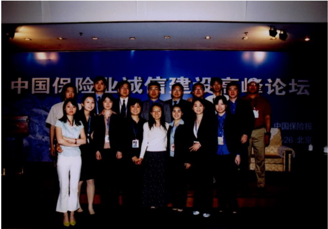
中国保险业诚信建设高峰论坛会议现场