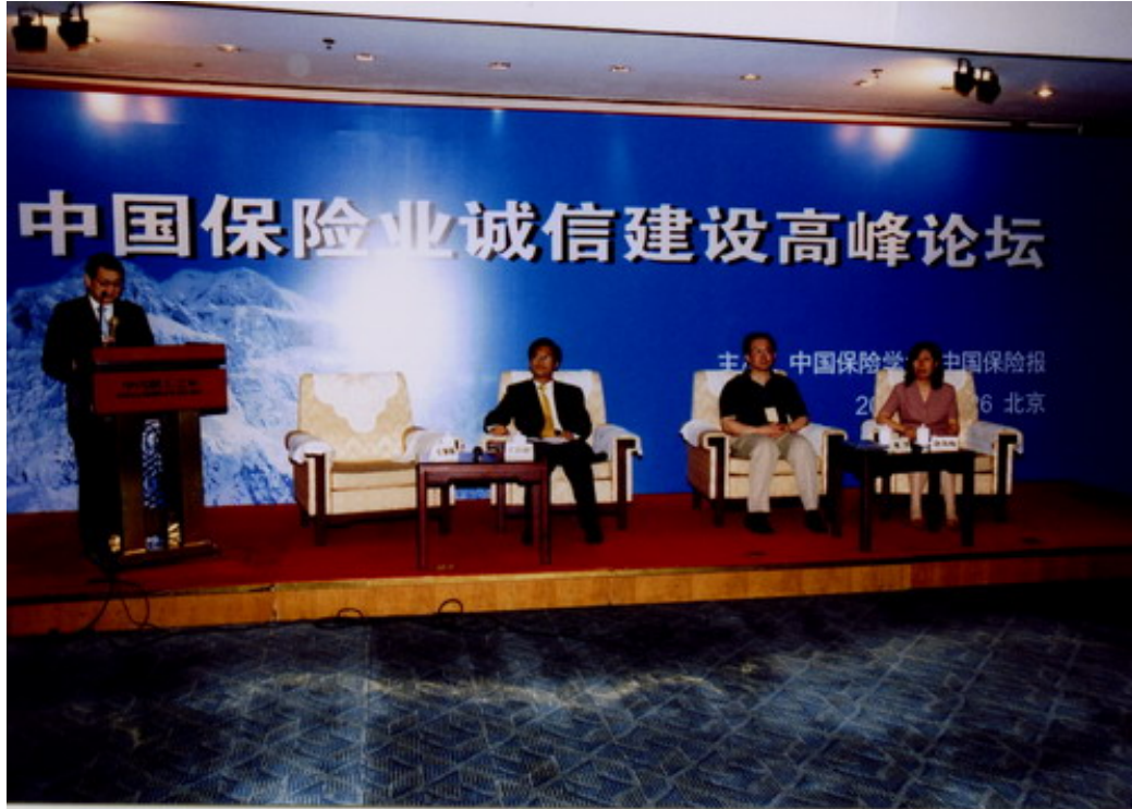
中国保险业诚信建设高峰论坛会议现场