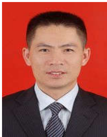
南京审计大学金融学院