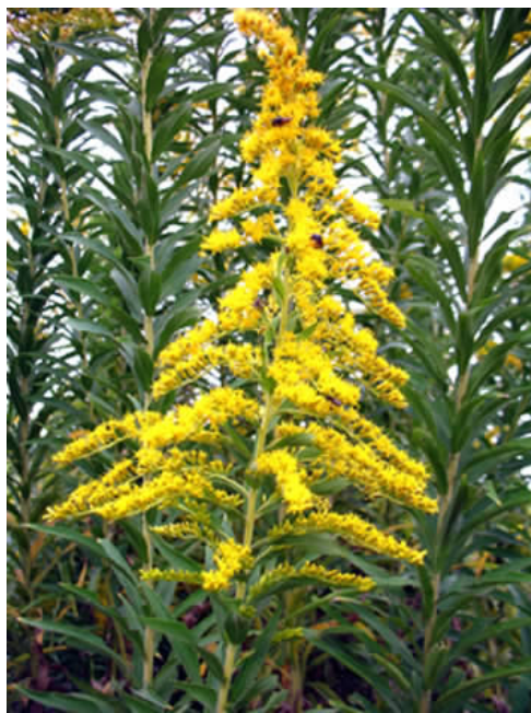
图2 北美一枝黄花已成为我国南方的新入侵物种

东输等大型工程的建成,一些东部物种可能将向西扩展。入侵植物北美一枝黄花和豚草等很可能快速侵入西部(图2)。