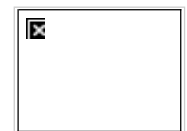
首届联合国世界地理信息大会今年11月在浙江德清举行